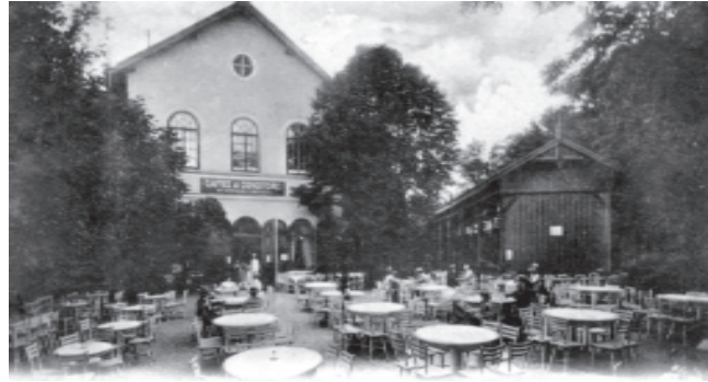
Frenzt cukrászda, Erlenpark

A futballpálya megmaradt, azonban itt fél évszázad múlva, 1977–1981 között a fából készült lelátókat kicserélték, befogadóképességüket megnövelték, így 12 000-ról 24 000-re emelték a helyek számát. Napjainkban folyamatosan fejlesztik a stadiont: bővítik, lefedik, a játékpályát alulról fűtik, és éjszakai világitást vezetnek be.