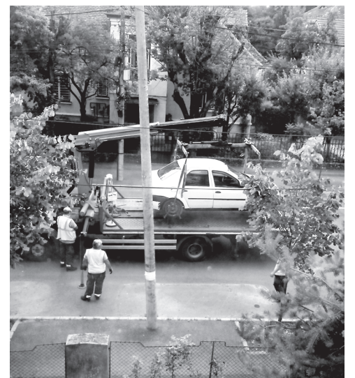
Így emelik a törvénytelenül parkoló autókat Nagyszebenben

Az elszállított autókat 24 órás munkaprogram keretében adják vissza a tulajdonosoknak, a pénztár folyamatosan nyitva van.