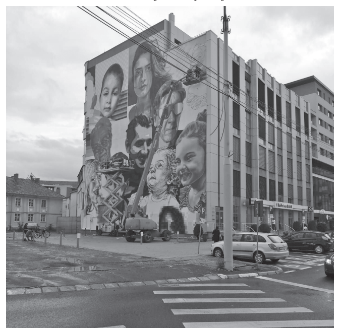
A Raiffeisen Bank oldalfala a Mihai Viteazu utca sarkán.