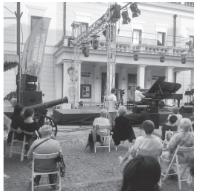
Szabadtéri koncert a Thalia színház előtt, a vírusjárvány idején.

A Transilvania Sportcsarnok új, 3x3-as fedetlen kosárlabdapályája nézőként vagy játékosként várja Önt! Szerkesztőség