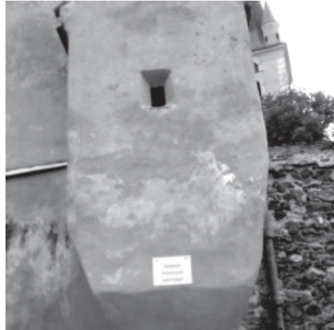
A keresztényszigeti pestis-szószer, a háttérben a második legnagyobb erdélyi harangtoronnyal

biztosítani. Gerhard Servatius-Depner plébános így magyarázza: „Egy kis konténert használsz, amely a rozetta közepén helyezkedik el. Van egy csőre, amelyen keresztül a bor egy „kanálra” folyik, és a kommunikátor szájába kerül. Egy csepp sem jön vissza. Egyszerre csak egy tiszta rozettát cserélsz, a maradék bort pedig egy másik edénybe öntöd.” Koronavírusos napjainkban az úrvacsora szentségének kiadása is változásokon megy át Romániában, akárcsak mindenütt Európában.