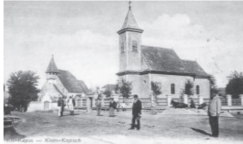
A régi központ (1905)

Legfontosabb feladata a főzés, kenyérsütés, a tej feldolgozása, az aprójószágok nevelése volt, a tojás hasznosításának számon tartása. Mindezt a nem férjezett lánya, vagy menyeg segítségével végezte. A tej, tejtermékek és a tojás eladásából származó pénzt ruházatkészítésre használta; de vigyázott arra, hogy a gazda ezt meg ne tudja, mert ő a közösből való elvonásnak minősítette volna. E pénzecskéből segítette a lányát, ebből fedezte unokái kisebb kiadásait. Egy másik