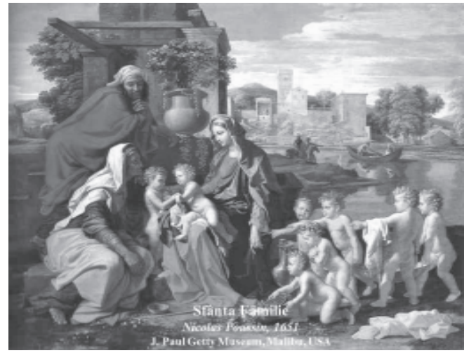
A szent család, Nicolas Poussin, 1651 – J. Paul Getty Museum, Malibu, USA

Különböző vallású, társadalmi helyzetű és korú hölgyek tartoznak a mozgalomhoz. Fontosnak tartjuk, hogy a nők megismerjék saját erőforrásaikat, a családon belüli kapcsolataik erősségeit és esetleges gyengéit is, hogy nyissunk egymás felé, és próbáljunk segíteni, ha szükség van ránk. Szeretnénk, ha mindenki otthon érezné magát ebben a közösségben, ha mindenkihez szólni tudnánk: legyen az édesanya, dolgozó nő, feleség, nagymama, egyedülálló nő, vagy akár olyan, aki több szerepet is betölt a felsoroltak közül. Nem kutatunk senki magánéletében, mindenki csak arról beszél, amit meg akar osztani, vagy amiben segítségre, tanácsra van szüksége. Azt is el szeretném