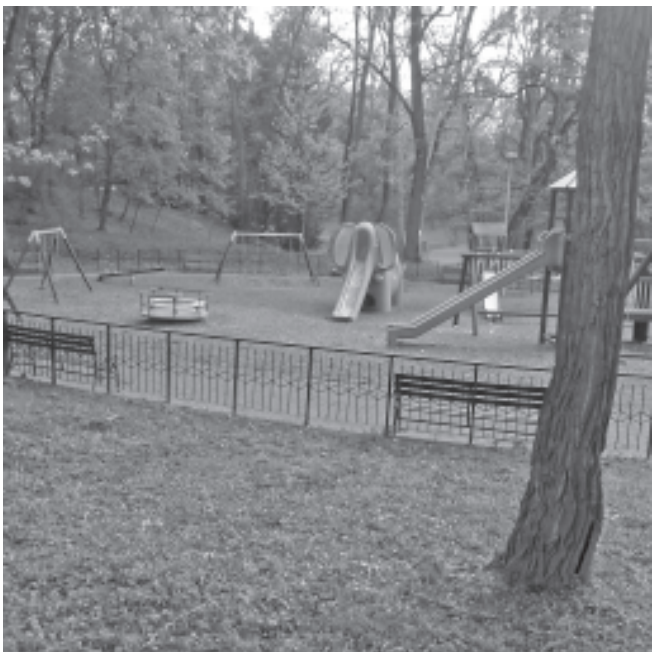
Parki játszótér a vírusjárvány idején.