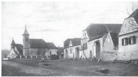
Hagyományos magyar házak a régi falu központjában

A két világháború között létrejött szellemi irányzatok a falu lényegét és hivatását meg nem értve a falut egyre inkább csak gazdasági és termelőegységnek tekintették, eszerint értékelték. A falut mezőgazdasági üzemmé, a földművelő falusi embert, a parasztot pedig mezőgazdává alakították volna. A gazdálkodás viszont a paraszti létnek nem az egyedüli foglalatossága, hivatása; így a kiskapusi falusi embernek is a földművelés és állattartás mellett megvoltak a saját szokásai és hagyományai, bajai és nehézségei, nélkülözései. A szokásaihoz híven ragaszkodott, és gyakorolta azokat munka közben, a szabadidejében, hétköznapokon és ünnepnapokon egyaránt. A bajt nem mindig tudta elkerülni, egyes nehézségeit csak részben oldotta meg, de az életmindig ment tovább, ezek a nélkülözések és nehézségek „sózták”, tették szebbé a kemény falusi életet. Igaz, hogy a faluközösség jellegzetes életformáját a gazdálkodás szabta meg, hiszen a falusi gazda ezzel szerezte meg magának és hozzátartozóinak a mindennapi kenyeret, ruháit, lábbelijét.